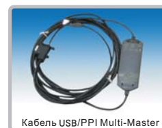
Кабель USB/PPI Multi-Master